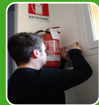
Formação em Contexto de Trabalho Internacional