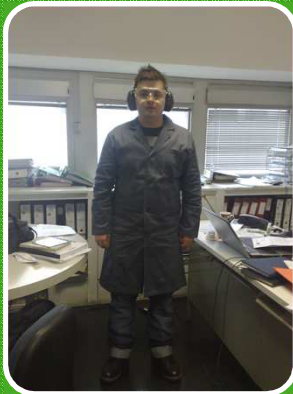
Formação em Contexto de Trabalho