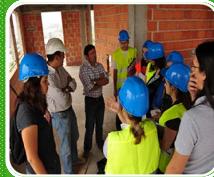
Auditorias externas de SHT