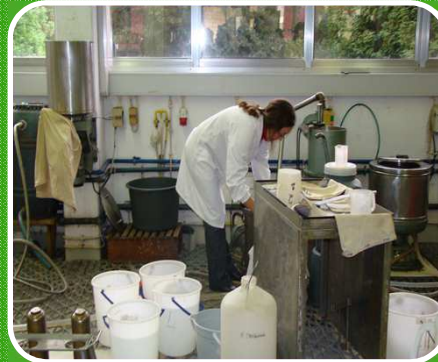
Controlo e Avaliação de Riscos